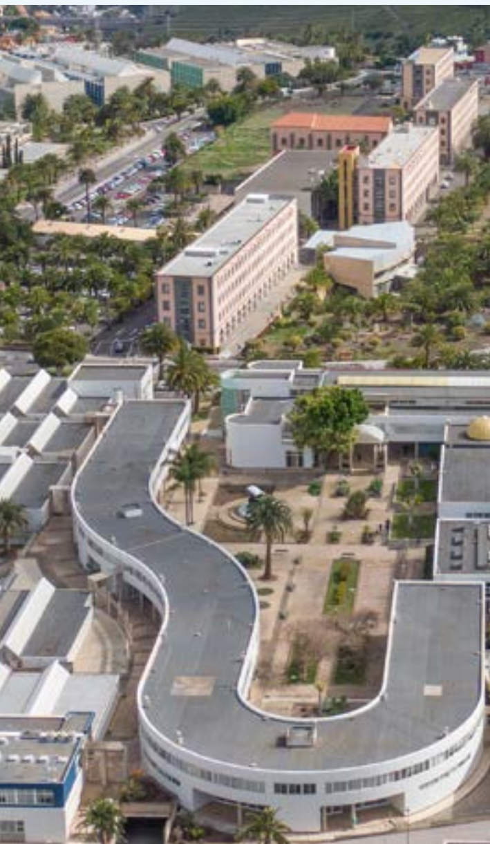
IMAGEN: Escuela de Ingenierías Industriales y Civiles en el Campus de Tañra (Gran Canaria)